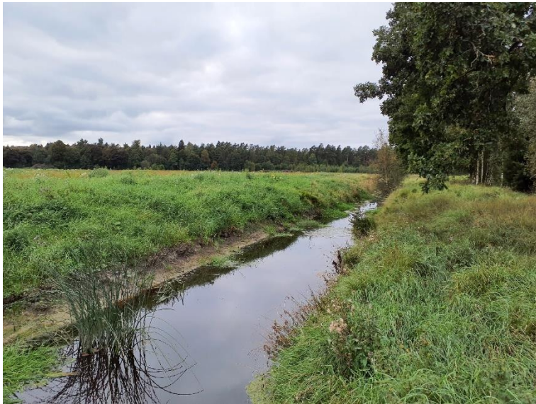
NVO 7: Öppet dike, klass 3