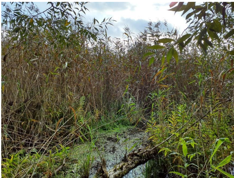
NVO 5: Vassbestånd, klass 3