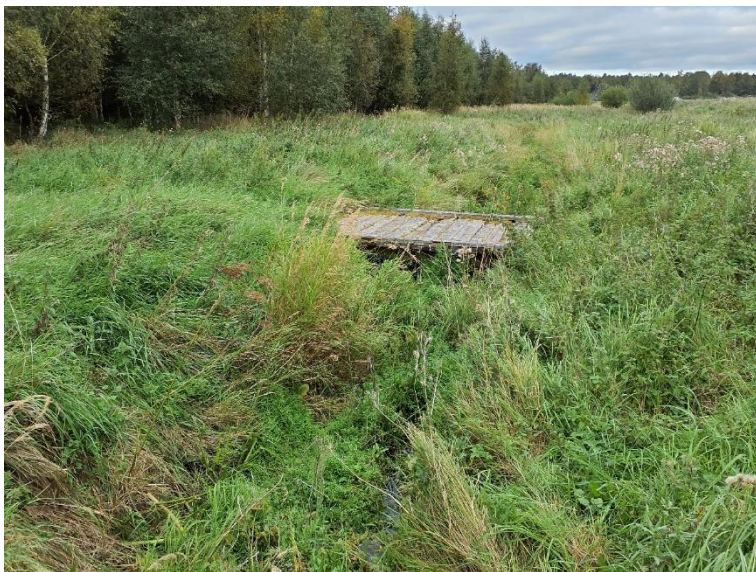
NVO 8: Öppet dike, klass 3 (preliminär)