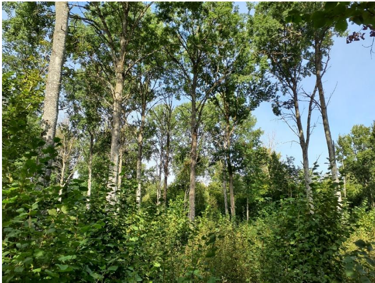
NVO 1: Aspskog, klass 3