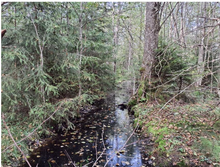
NVO 17: Öppet dike, klass 3