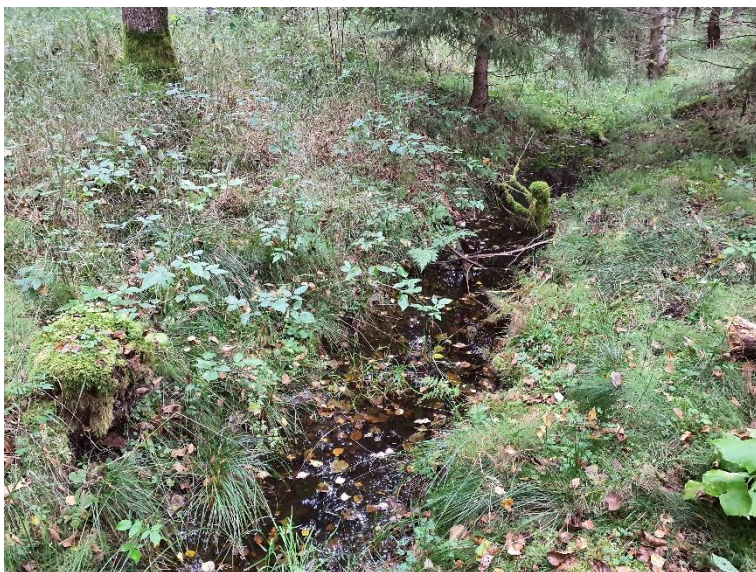
NVO 18: Öppet dike, klass 3 (preliminär)