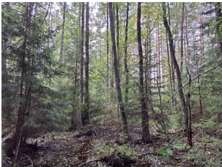
NVO 25: Alsumpskog, klass 3