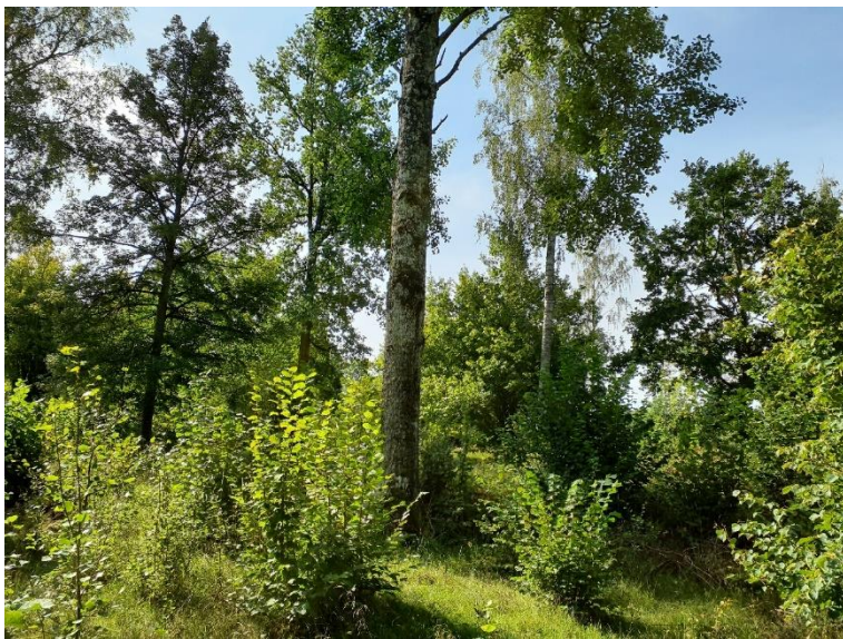
NVO 2: Trädklädd betesmark, klass 3