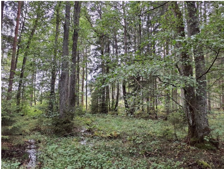
NVO 19: Alsumpskog, klass 3