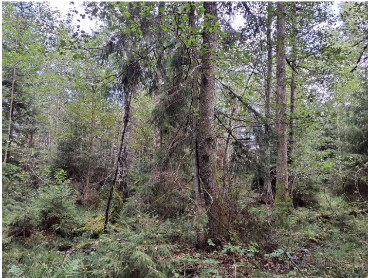
NVO 16: Alsumpskog, klass 3