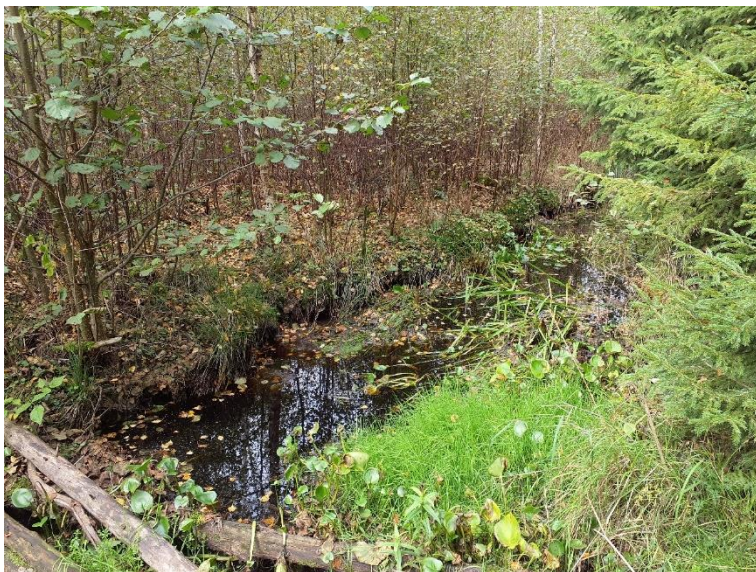
NVO 20: Rätad bäck, klass 3