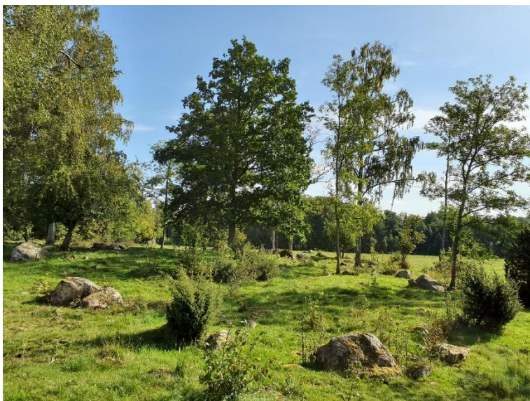
NVO 3 Trädklädd betesmark, klass 2