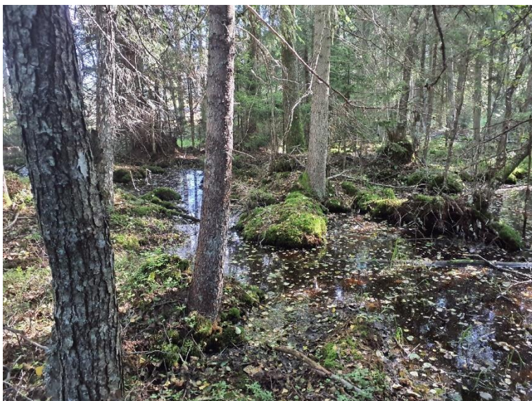
NVO 15: Blandsumpskog, klass 3