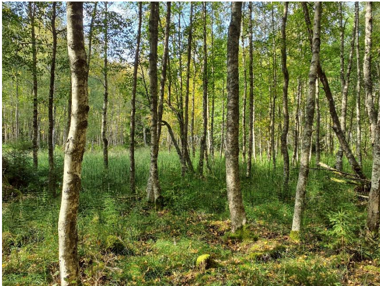
NVO 22: Björksumpskog, klass 3