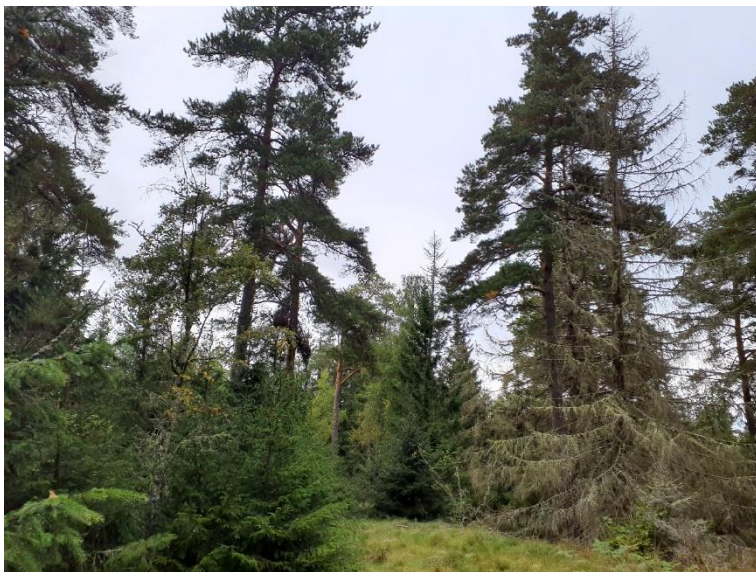
NVO 14: Blandskog, klass 3