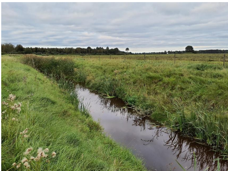
NVO 9: Öppet dike, klass 3 (preliminär)