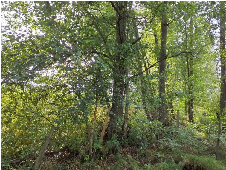
NVO 4: Alsumpskog, klass 3