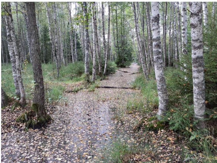
NVO 23: Öppet dike, klass 3