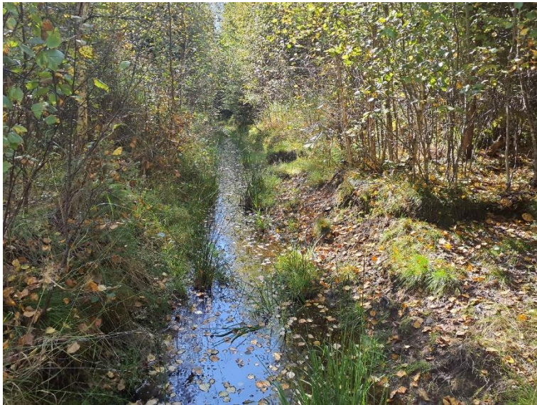
NVO 10: Öppet dike, klass 3 (preliminär)