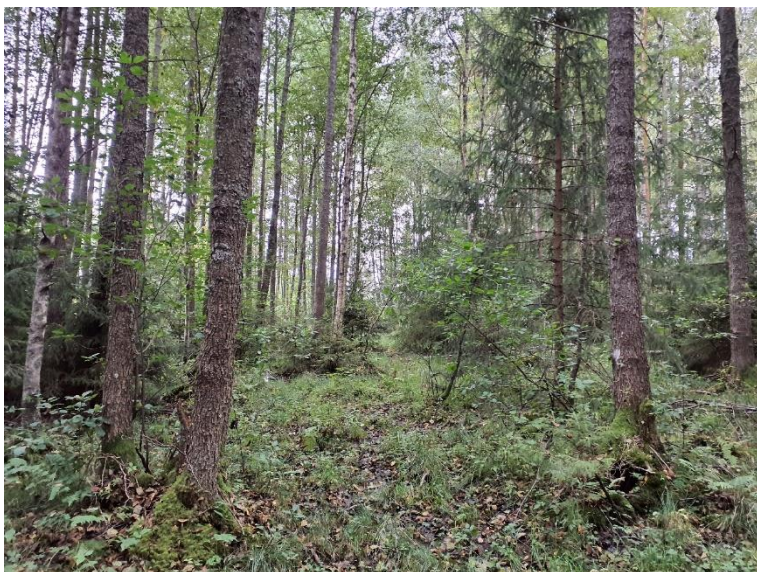
NVO 24: Lövsumpskog, klass 3