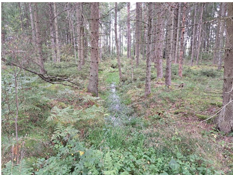
NVO 21: Öppet dike, klass 3 (preliminär)