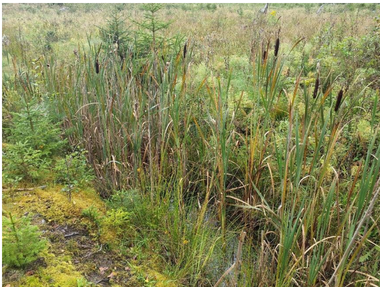
NVO 11: Öppet dike, klass 3 (preliminär)