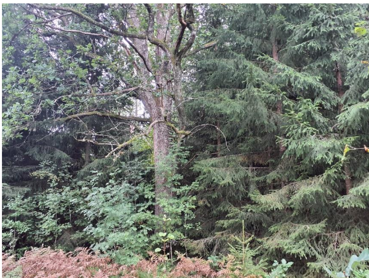
NVO 12: Blandskog, klass 3 (preliminär)