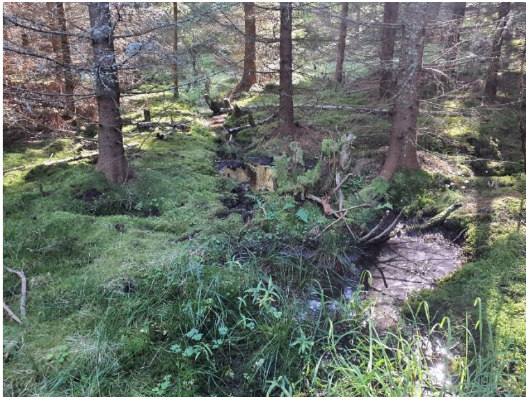
NVO 13: Öppet dike, klass 3 (preliminär)